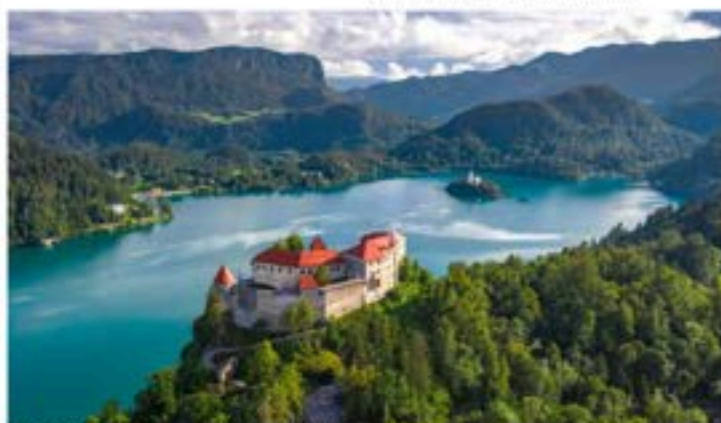
Vid Bledsjön, Blejsko Jezero börjar den 270 km långa vandringsleden Juliana Trail som går genom nationalparken Triglav.