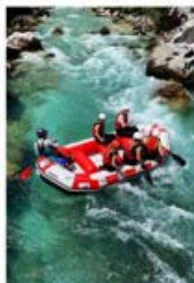
I de slovenska alperna erbjuds många friluftaktiviteter, bland den populära forsränningen längs floden Soča.

Mer info: visitljubljana.com , Slovenia.info