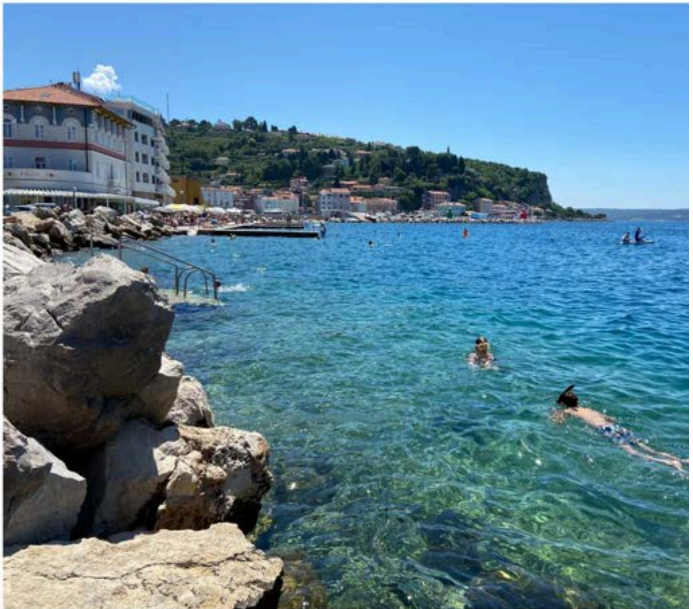
I sydväst har Slovenien en kort men fin kust mot Adriatiska havet. Piran är en av de mest välkända kustparterna i landet.