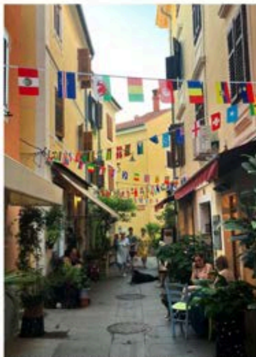
Den lilla kuststaden Izola har mysiga gränder med livligt restaurangliv och småskalig shopping med bland annat olika typer av hantverk.